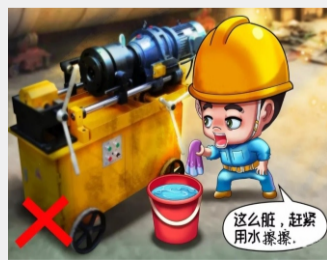
不用水冲洗揩擦电气设备