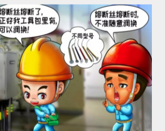
不调换容量不符的熔丝