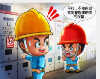
不启动挂有警告牌的电气设备