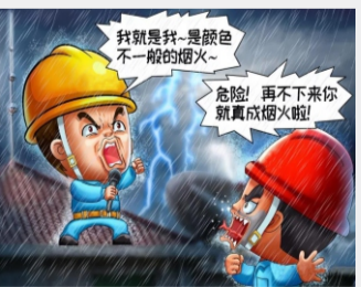
雷电时，不接近避雷器和避雷针