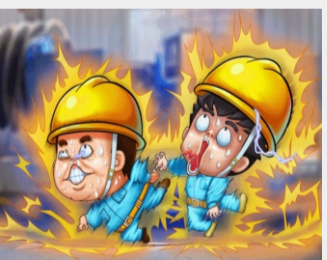
不盲目对触电者进行施救