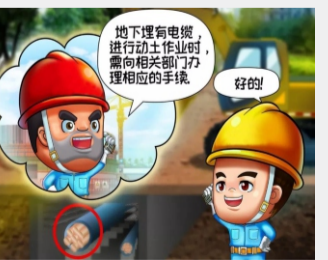
未办手续，不在埋有电缆的地方打桩动土