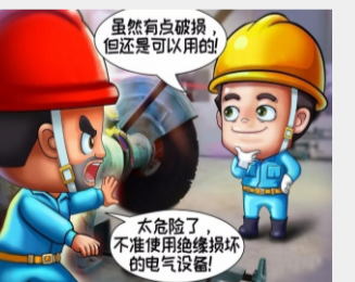
不使用绝缘损坏的电气设备