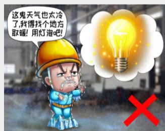
不利用电热设备和灯泡取暖