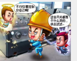
不玩弄电气设备和开关